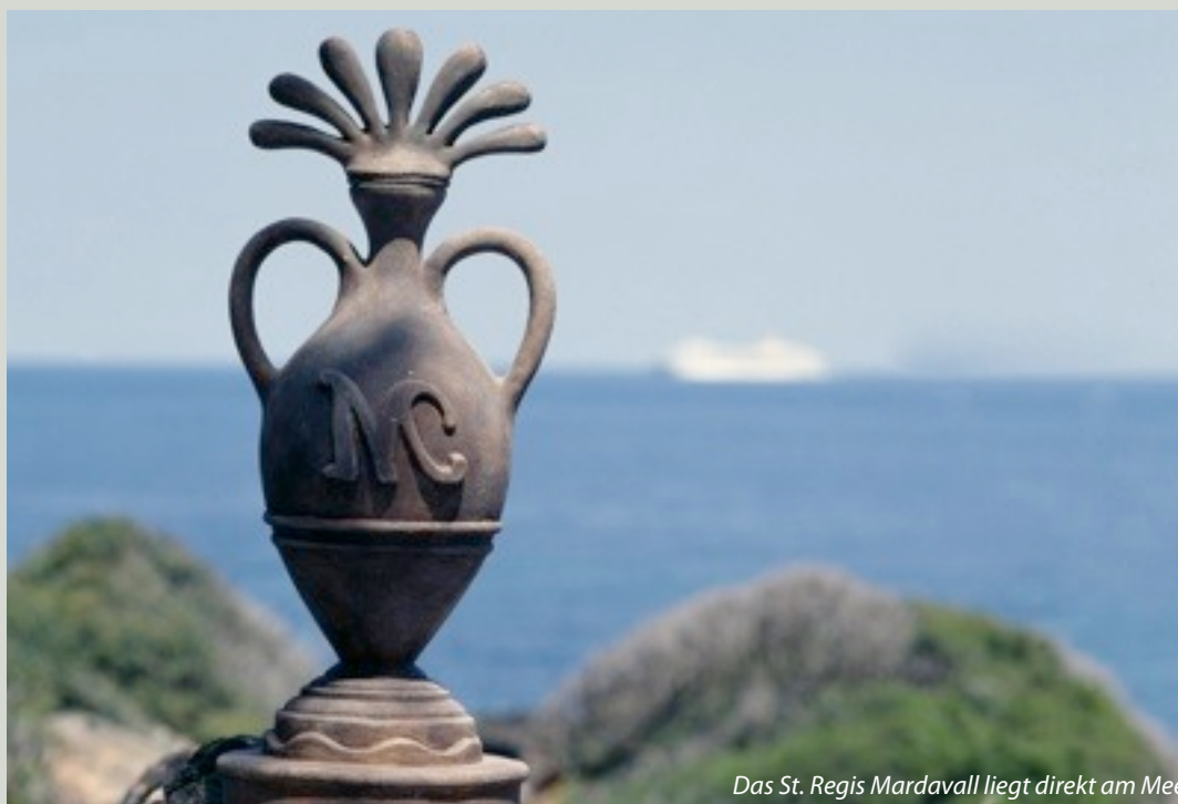
Das St. Regis Mardavall liegt direkt am Meer