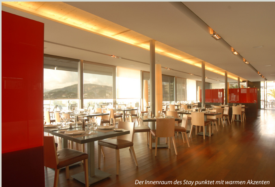
Der Innenraum des Stay punktet mit warmen Akzenten